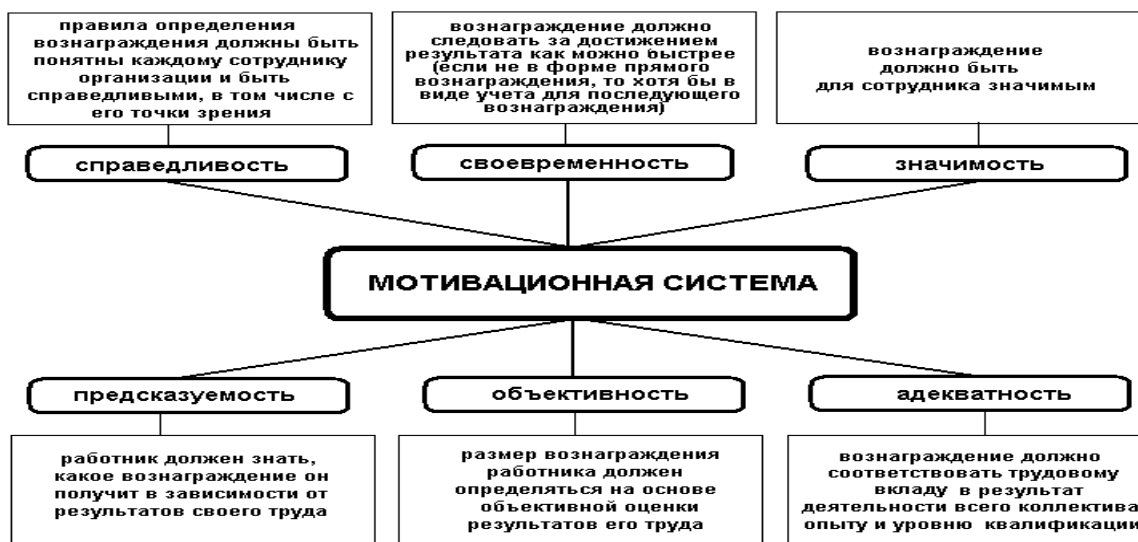
Рисунок 1.1 – Система мотивации персонала предприятия